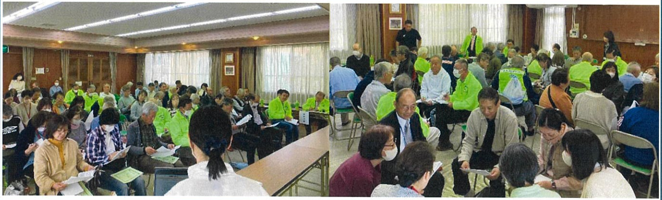
まちづくりミーティングの様子 (右・左)

4月11日土曜日に、岡崎学区市民ホーム2階で第4回目となる協議体「まちづくりミーティング」が開催されました。岡崎学区福祉委員会総会後の時間を利用して開催しました。本ミーティングは、学区福祉委員会との共催で、総代会、民生児童委員協議会にもご協力いただき、初年度は34名の参加でしたが、強制ではないにも関わらず今年度は56名に増えました。