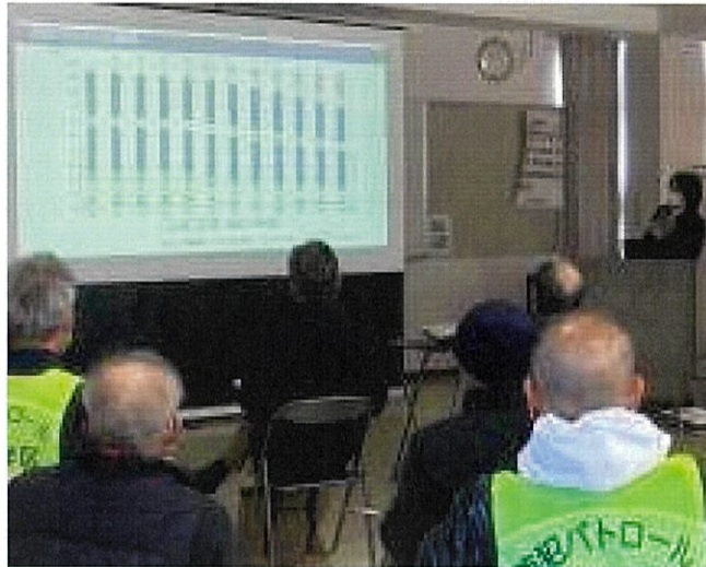
写真左：総括で「皆で視野を広げて共有しあっていきましょう」とメの挨拶を下された大河内総代会長