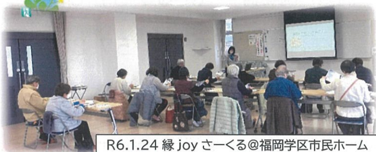
R6.1.24 縁 joy さーくる@福岡学区市民ホーム

この写真は、当包括主催の縁 joy さーくるです。「最期まで安心に～住まいとお金～」というテーマで、施設や要介護になった場合にかかる費用、お金の管理方法を学びました。