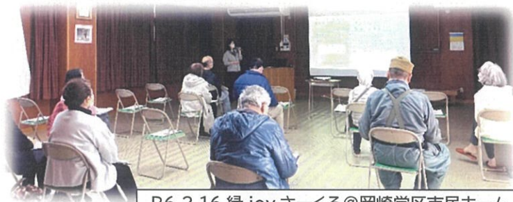
R6.2.16 縁 joy さーくる@岡崎学区市民ホーム

今年度も当包括では、地域での通いの場のご紹介や、健康づくり、生きがいを持てるような情報提供を行っていきます。